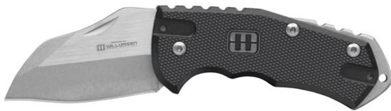
Figur 2. Eksempel på mindre foldekniv, der i dag lovligt kan besiddes alle steder, herunder i nattelivet, og som ifølge politiet bl.a. optræder i nattelivet og visse kriminelle miljøer.