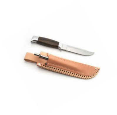
Andre typer knive